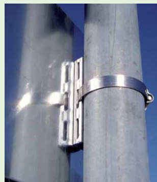
Standard Pfosten, rund