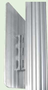
KETTNER Alu-Fix Pfosten